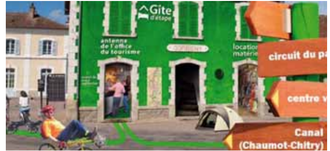
RÉGION BOURGOGNE, GARE DE CORBIGNY

Avec les outils du design et de la sociologie, l'équipe en résidence a tenté de déterminer comment cette problématique à la fois économique, sociale, environnementale et culturelle pouvait faire projet entre un établissement d'enseignement agricole et des acteurs locaux engagés dans la promotion de leur terroir.