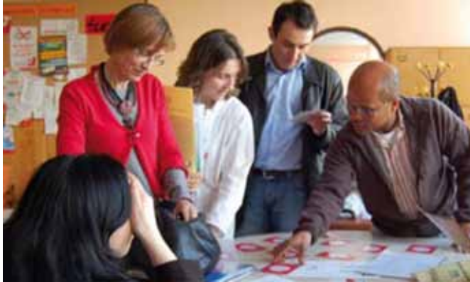
RÉGION CHAMPAGNE-ARDENNE / LYCÉE JEAN MOULIN À REVIN