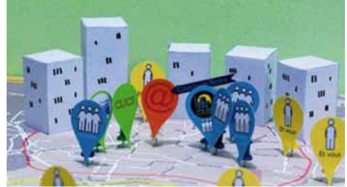
RÉGION PROVENCE-ALPES CÔTE D'AZUR, ESPACE PUBLIC NUMÉRIQUE DE LA SEYNE SUR MER

Entre la vision théorique et la réalité, il y a un fossé qu'une équipe en immersion a tenté de réduire, entre mars et mai 2010. En travaillant avec les lycéens et les professeurs sur leur façon d'habiter le lycée, et en étudiant leur rapport à l'espace architectural, l'équipe a proposé des aménagements à court et moyen terme, et inventé des réglages applicables tout de suite dans la vie des lycéens.