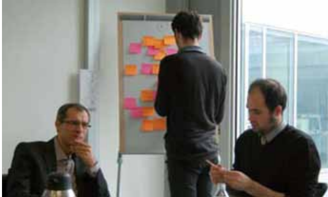
RÉGION NORD-PAS DE CALAIS / HÔTEL DE RÉGION À LILLE