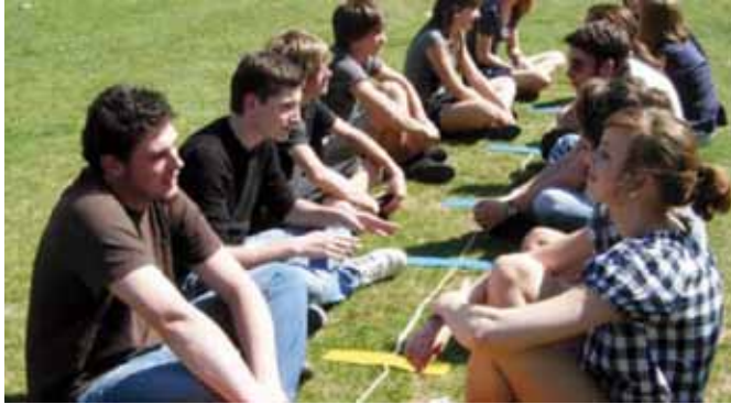
RÉGION RHÔNE ALPES, LYCÉE GABRIEL FAURÉ