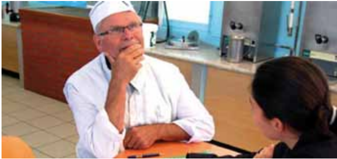
RÉGION CHAMPAGNE ARDENNE, LYCÉE AGRICOLE BALCON DES ARDENNES