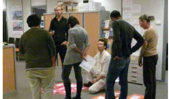
RÉGION PROVENCE-ALPES CÔTE D'AZUR / HÔTEL DE RÉGION À MARSEILLE

Trois élus membres de l'exécutif régional se sont prêtés au jeu en laissant une équipe observer, comprendre, questionner, co-concevoir et expérimenter avec eux et leurs collaborateurs de nouvelles méthodes et de nouveaux outils de travail.