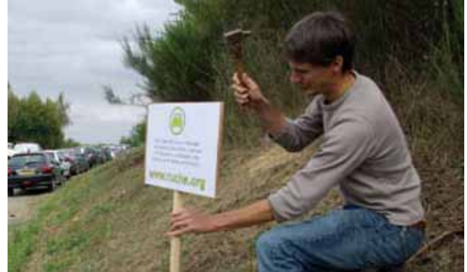
RÉGION BRETAGNE / RÉSEAU SOCIAL RENNAIS LARUCHE.ORG

Une équipe interdisciplinaire s'est immergée à Revin pour aider les lycéens, les professeurs, l'administration et les habitants à influencer sur le nouveau projet architectural, et concevoir avec eux une douzaine de projets susceptibles d'ouvrir le lycée sur la cité et sur la société.